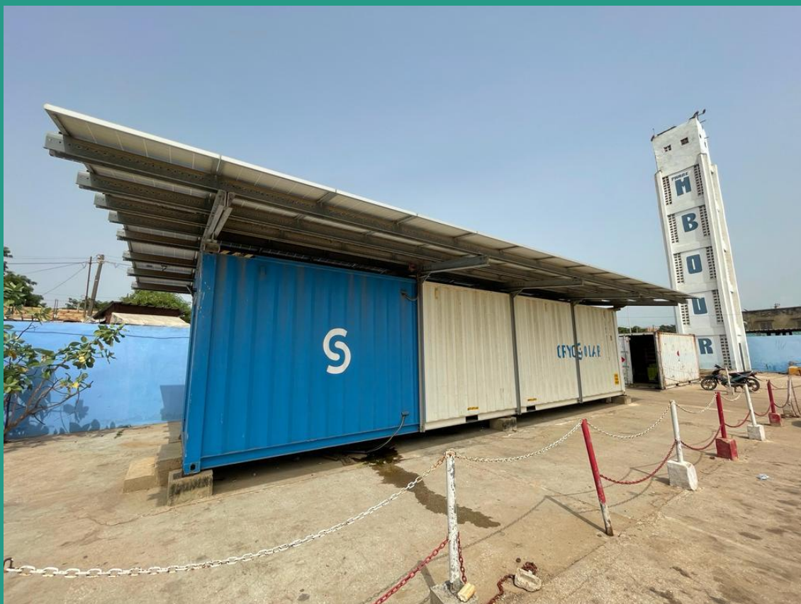
Quai de pêche de Mbour – Sénégal