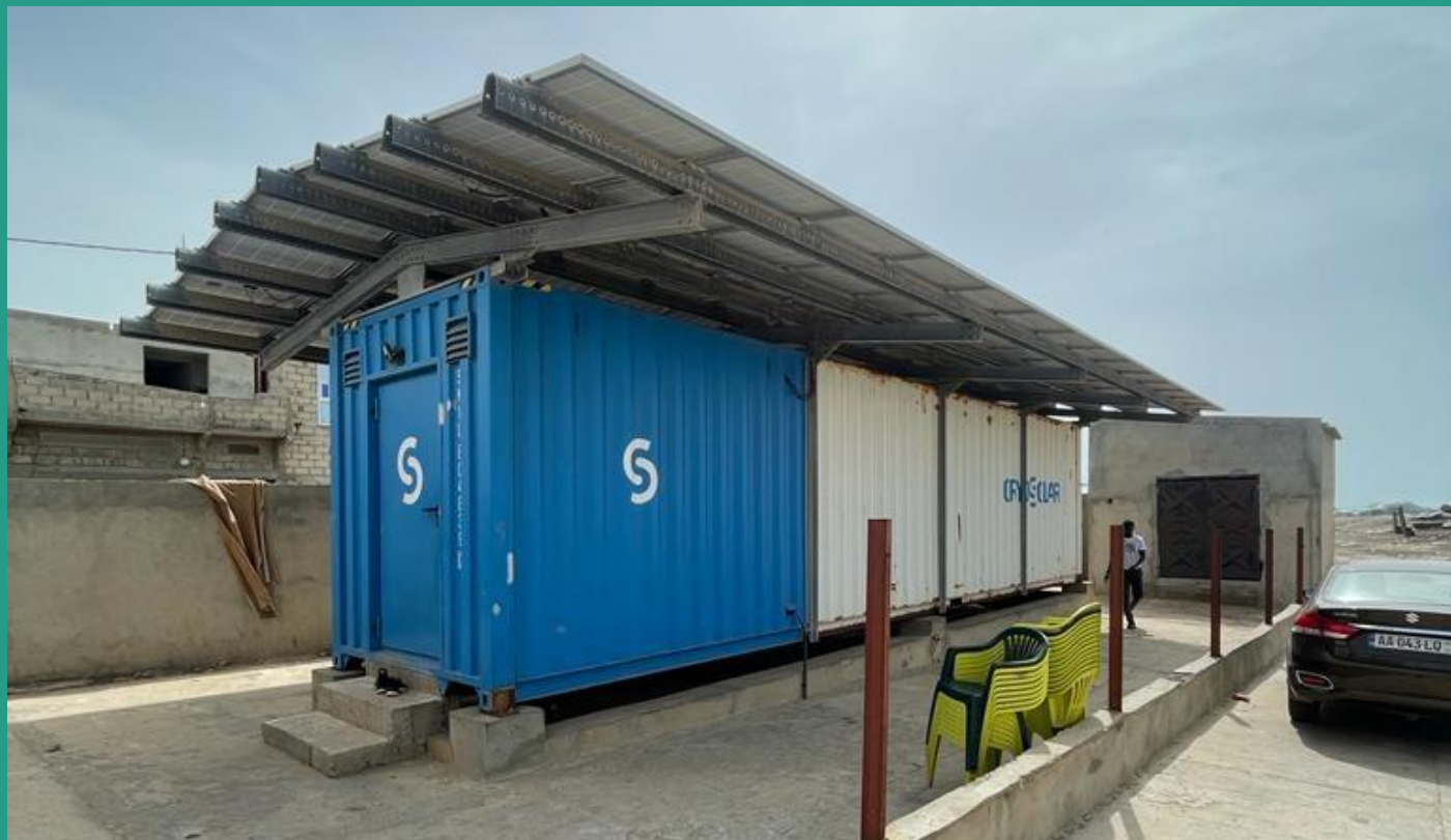
Quai de pêche de Fass Boye – Sénégal