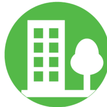
Nature biodiversité et agriculture urbaine