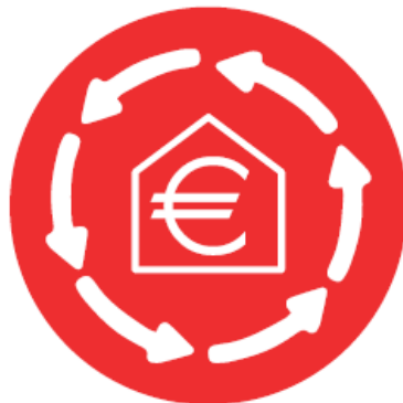
Matériaux bas carbone et économie circulaire