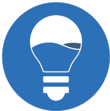
Energie et eau