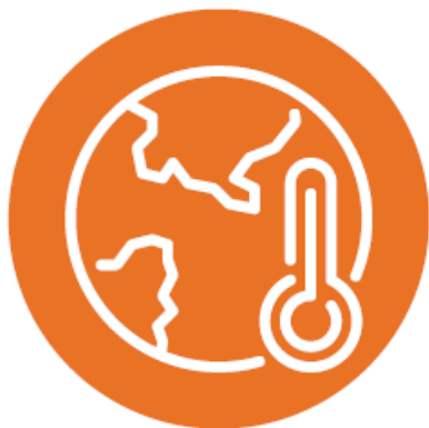
Adaptation au changement climatique