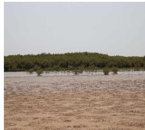
Salinisation des sols