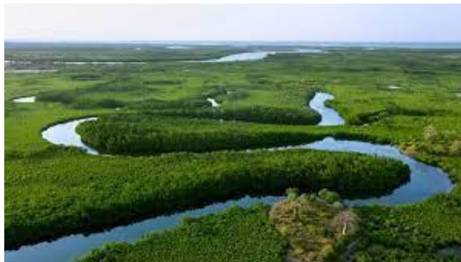
Aire Marine Protégée