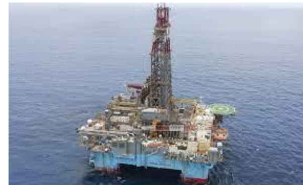
Champ pétrolier Sangomar