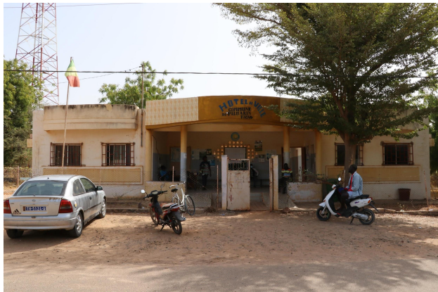
Mairie de Palmarin