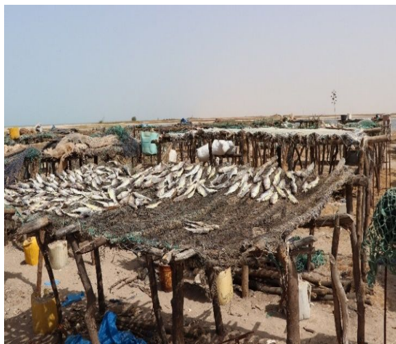
Exploitation non rationnelle