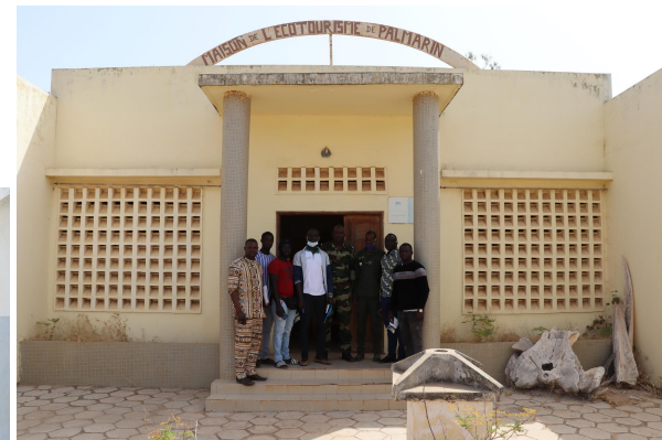
Maison de l'écotourisme de Palmarin