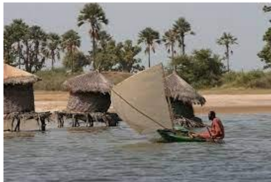
Réserve Naturelle Communautaire