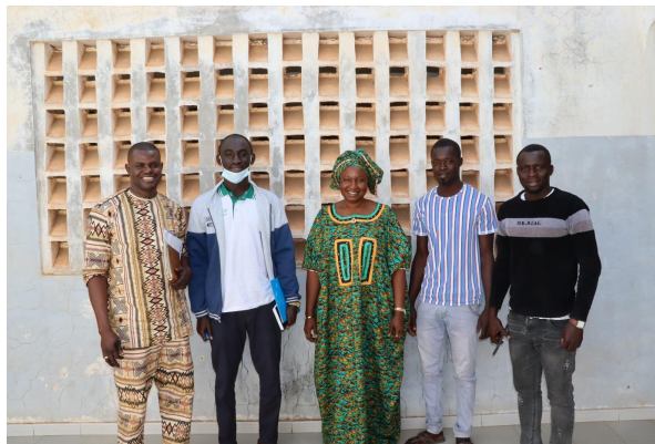
Equipe de la mission