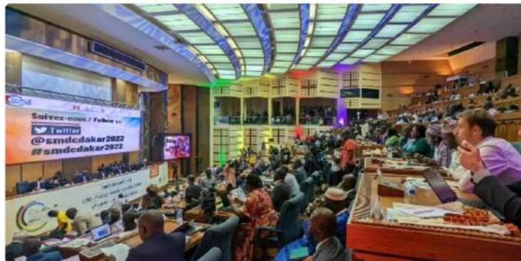
La cérémonie d'ouverture s'est déroulée à l'hôtel King Fahd Palace.

Plusieurs centaines d'acteurs et experts sont réunis dans la capitale sénégalaise jusqu'à vendredi, à l'occasion de la « semaine de la mobilité durable et du climat ». L'événement a été ouvert ce mardi par le premier ministre.