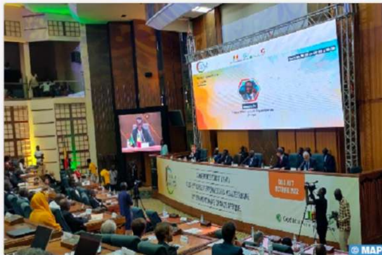
Dakar 04/10/2022 (MAP)- Les travaux de la Semaine de la Mobilité Durable et du Climat (SMDC), se sont ouverts, mardi à Dakar, avec la participation de plusieurs experts, chercheurs et délégations internationales, dont du Maroc.

📅 4 Octobre · 👁 18 · 📁 Environnement/Eaux/Forêts (4578), 📄 📧 🔄