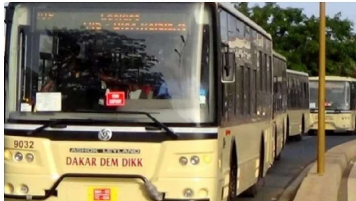
Bus de transport urbain Dakar Dem Dikk

Le Sénégal abritera la Semaine de la mobilité durable et du climat, du 3 au 7 octobre 2022. A l'issue de cette rencontre internationale de haut niveau sera adoptée la « Déclaration de Dakar », qui sera une contribution majeure à la COP27.