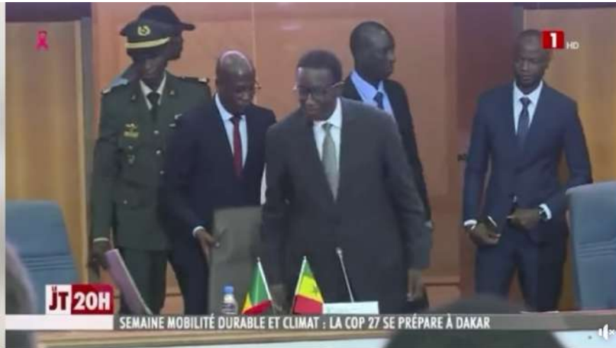
SEMINE MOBILITE DURABLE ET CLIMAT : LA COP 27 SE PREPARE A DA...

https://www.rts.sn/ - https://www.youtube.com/watch?v=fVEOFijzSxc