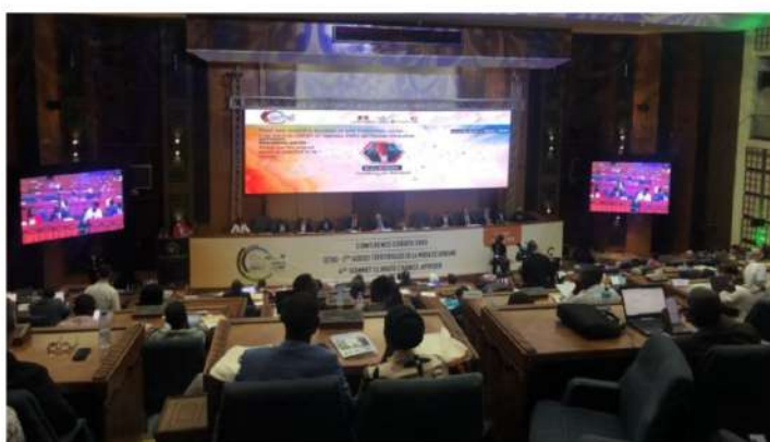
Semaine de la mobilité à Dakar, au Sénégal

Par Afrik - Publié le 6 octobre 2022 à 23h13