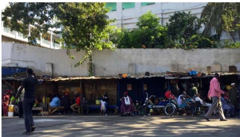
Vendeurs dans des magasins de rue, quartier du Plateau, Dakar, Sénégal.