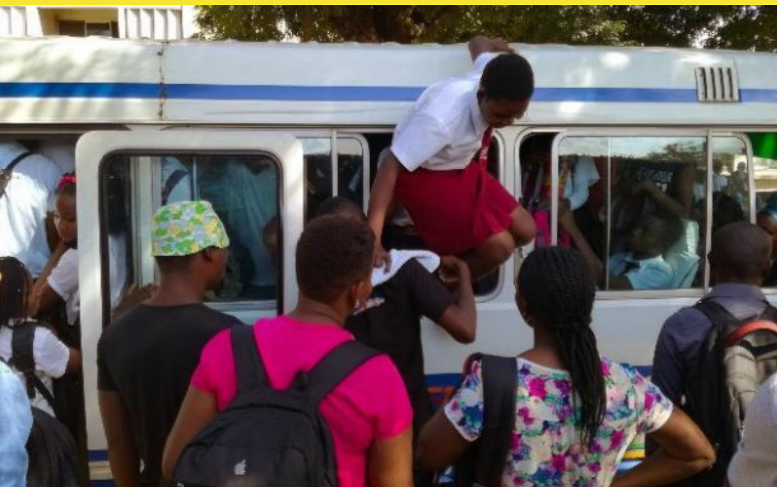
Intégrer la dimension de genre – Le cas de la mobilité à Maputo