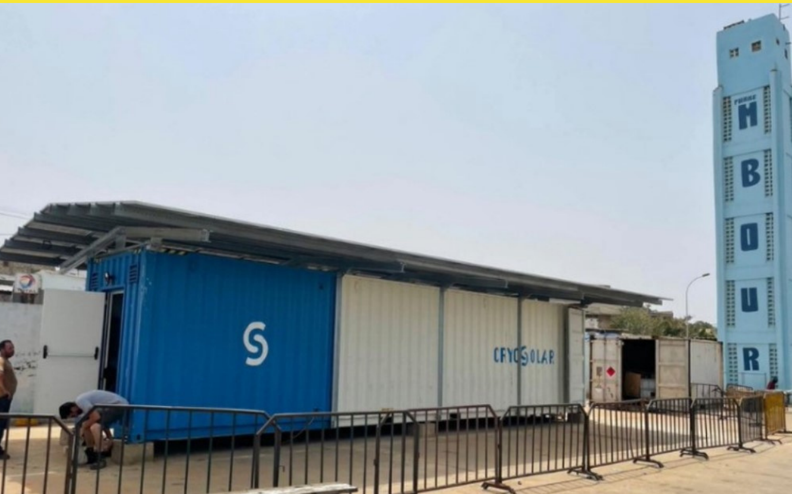
CryoSolar Mbour - Sénégal, 07.2021