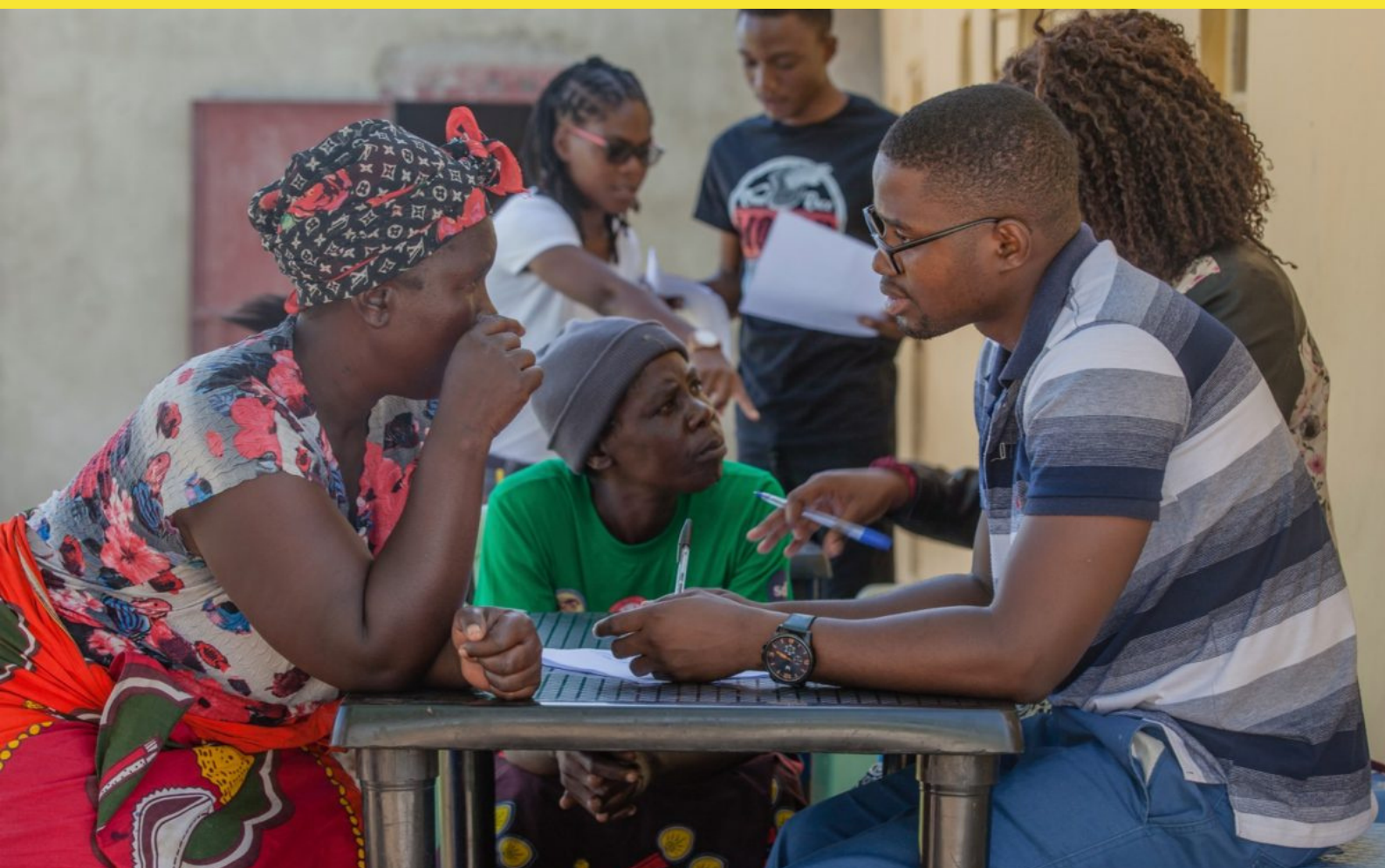
LoCAL - Local Climate Adaptive Living Facility