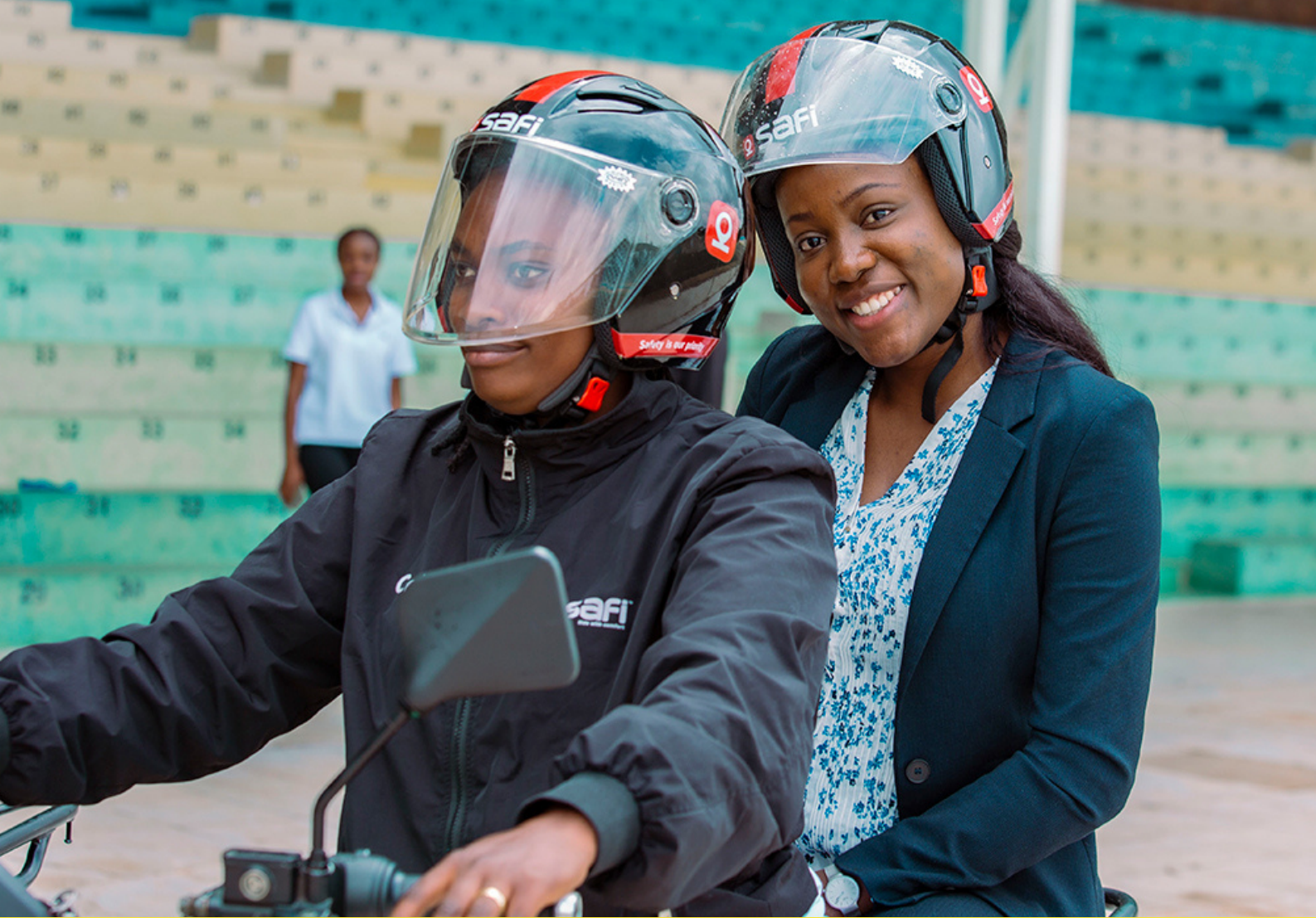
W.E.I.E - Autonomisation des femmes dans l'entrepreneuriat, SUL E-Mobility - SAFI Universal Link Ltd