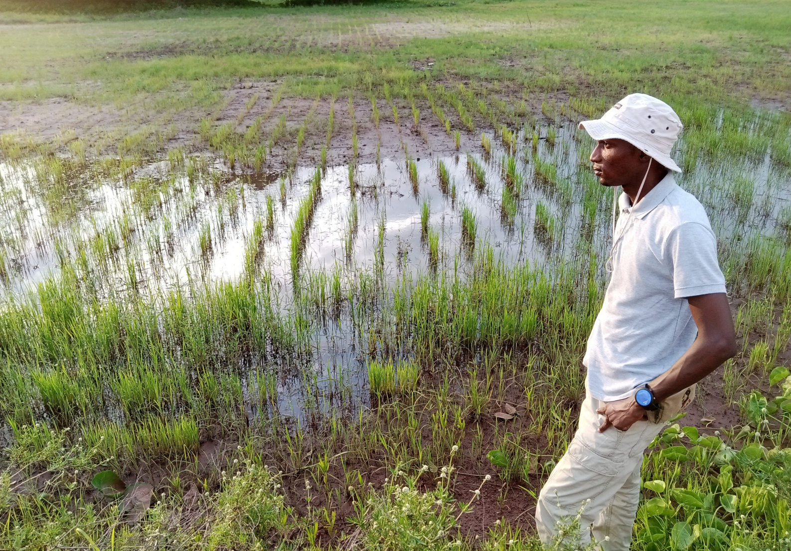
Contribution à la restauration des terres affectées par la salinisation (Région de Fatick)