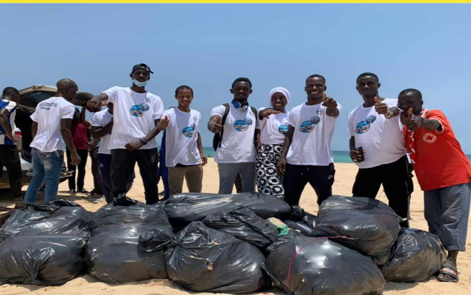
CRAC - Cadre de réflexion et d'action citoyenne