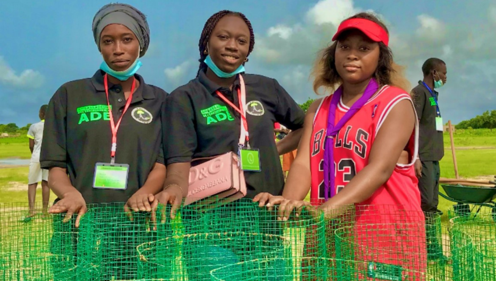
CRC - Campagne de reboisement communale