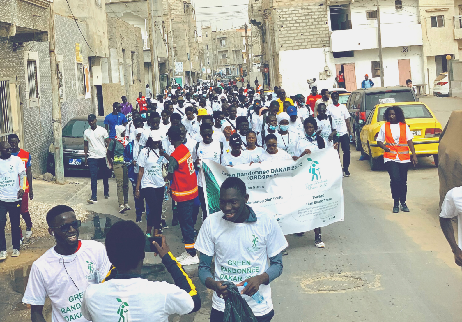
Green Randonnée Dakar 2022