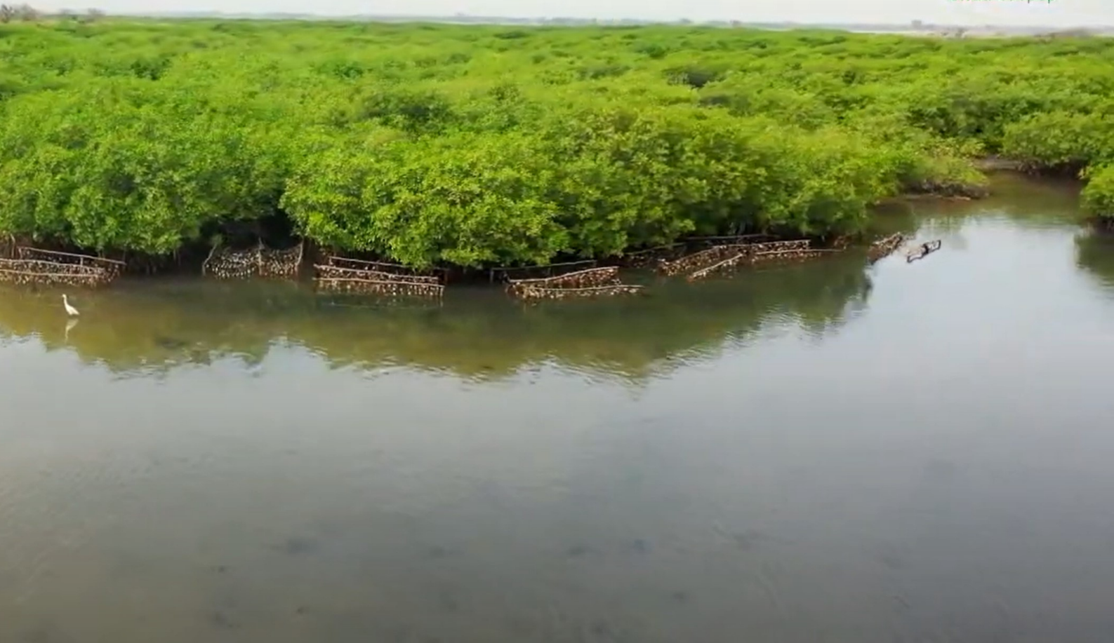
Projet d'appui aux modèles de valorisation des produits halieutiques dans la commune de Joal-Fadiouth