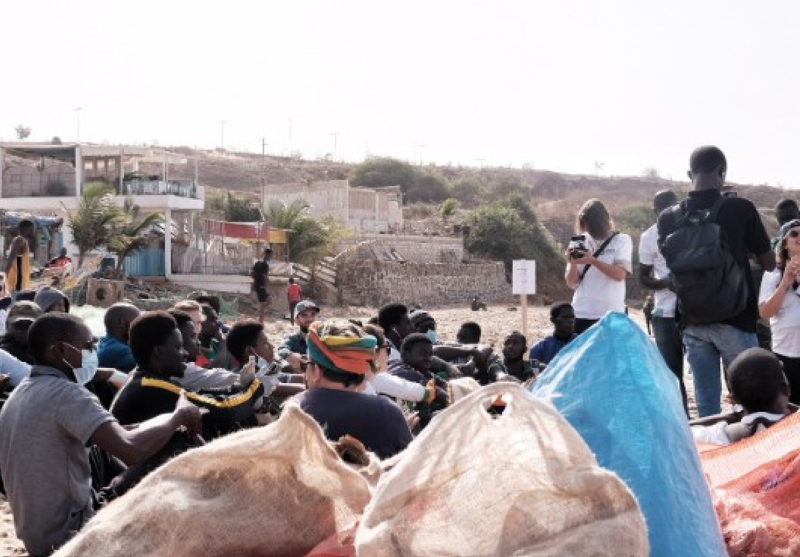
Plage durable, Dakar