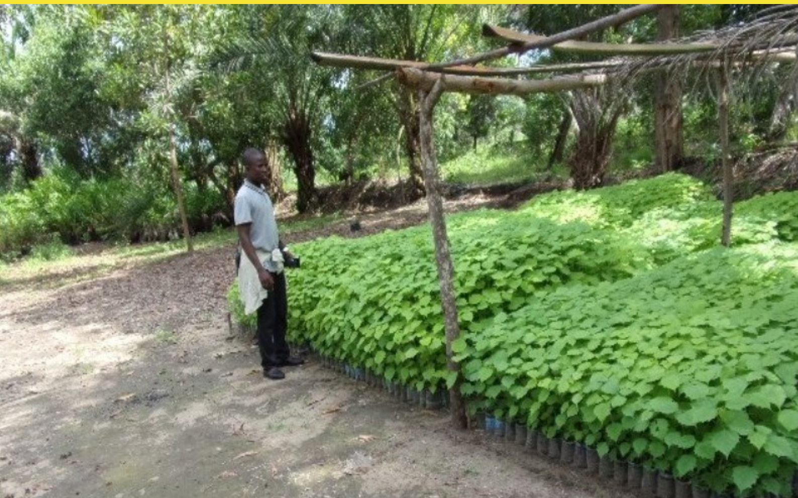
CAIM - Centre de l'Agriculture Intégrée Moderne