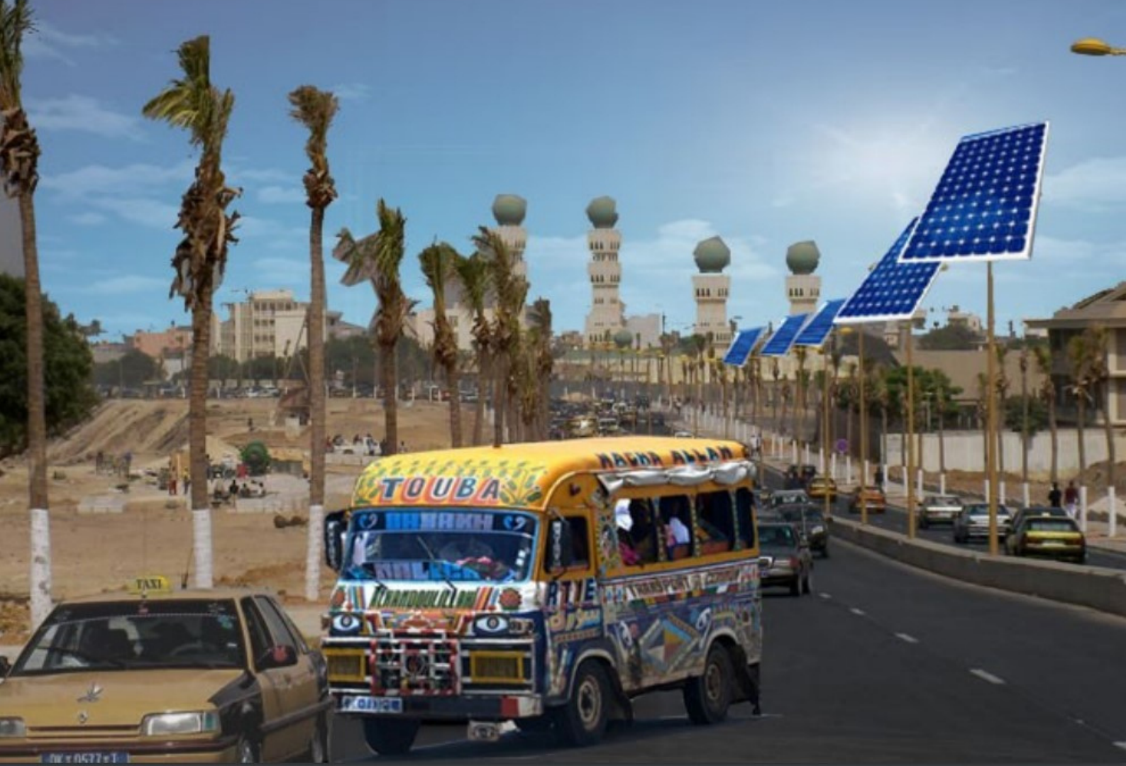
EcoCar Solaire - mobilité durable pour la ville africaine