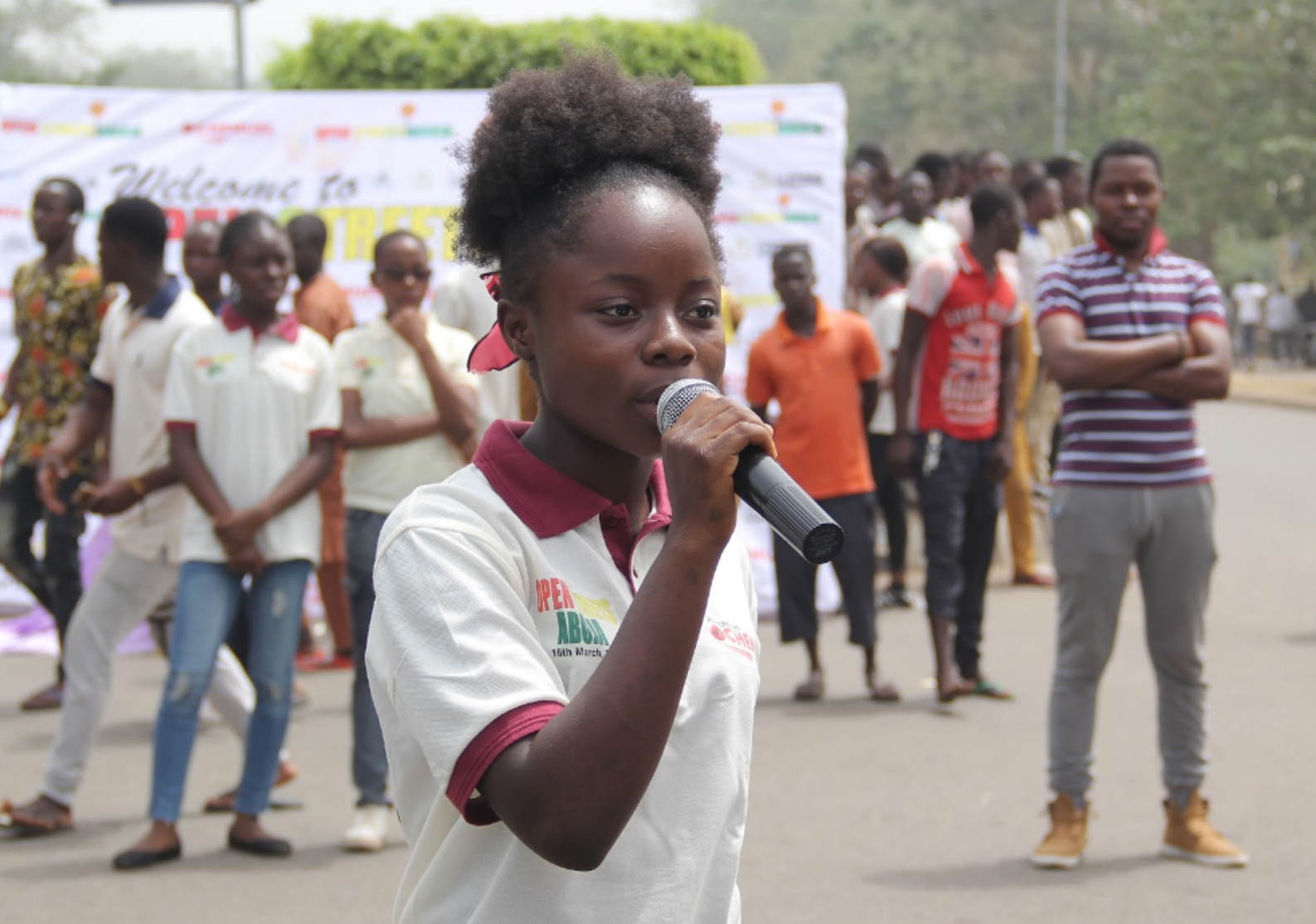
Open Streets Initiative, Abuja