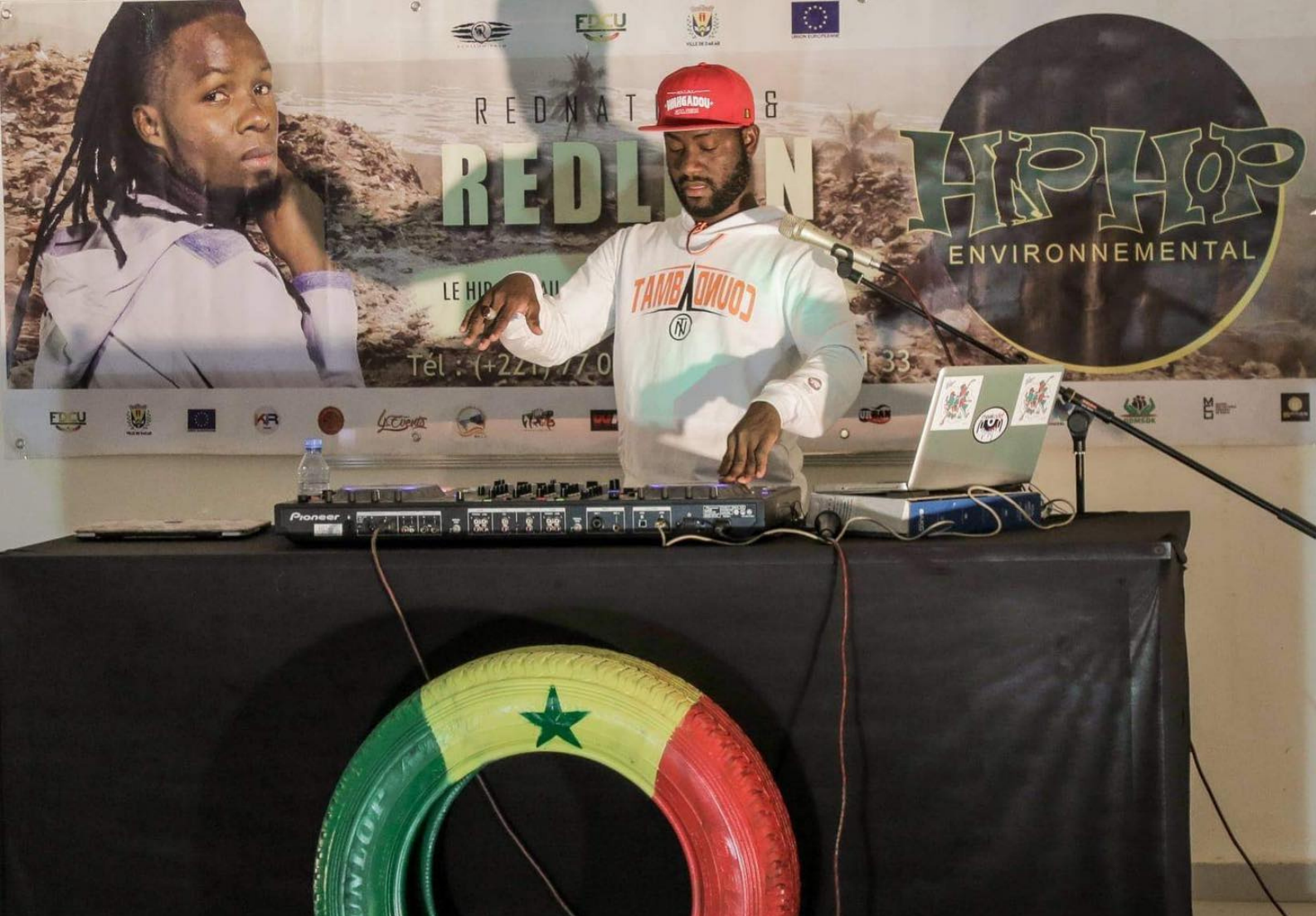
Festival international Hiphop environnement