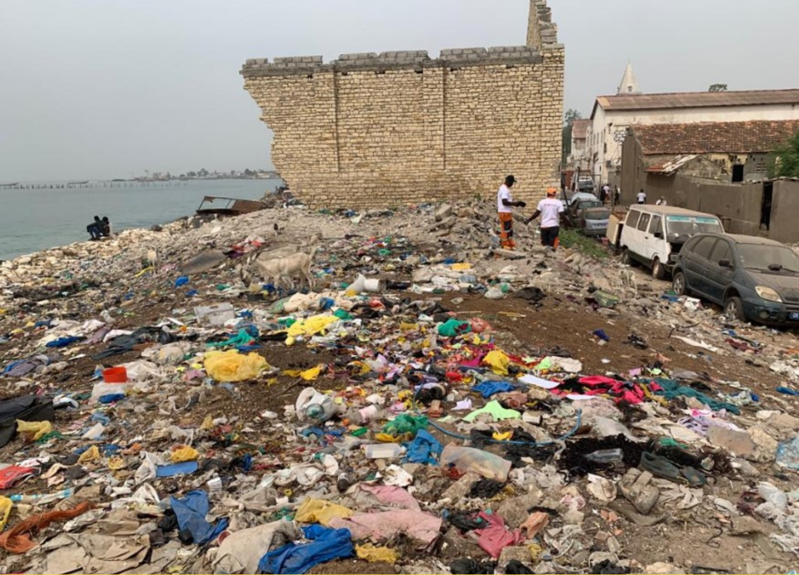
Projet de réaménagement du littoral de Keury kao (Rufisque)