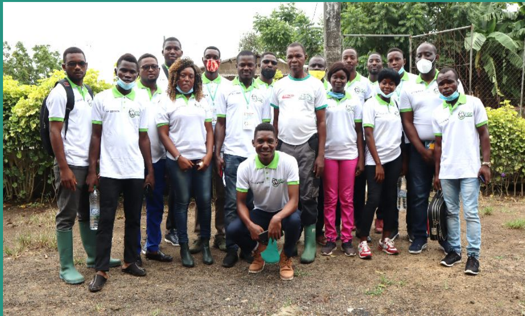
Projet Etre Jeune Et Entreprendre dans le secteur Vert; Family Green Corporation; 2021.

FGC : Des idées entrepreneuriale et de génération des revenus pour les jeunes.