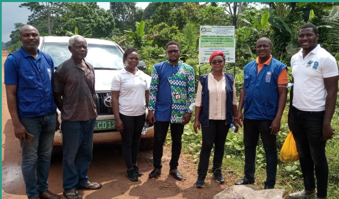
Family Green Corporation et PNUD GEF SGP Cameroun; 2021.

FGC active pour l'Environnement et les Peuples depuis 2016.