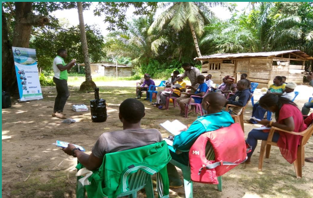
Projet GEVES-PROCOCI; Village Lindema.; Family Green Corporation; 2019.